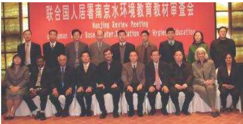
Les enseignants Sathya Sai lors d'une réunion d'ESSVH à Nanjing, Chine

Depuis son inauguration en l'an 2000, l'IESS-Philippines a dispensé des formations d'ESSVH à plus de 10.000 professeurs aux Philippines et dans d'autres pays d'Asie. En 2002, l'IESS-Philippines a accueilli une Convention Internationale de trois jours sur le thème : « Sathya Sai Educare – l'Intégration des Valeurs dans la Société ». Un total de 18 intervenants et animateurs de Brunei, d'Indonésie, de Malaisie, des Philippines et de Singapour y ont participé. 1.200 participants y ont assisté, y compris 30 diplomates et fonctionnaires gouvernementaux haut placés, 900 professeurs et éducateurs, 100 professionnels des affaires et du domaine médical et 90 jeunes.