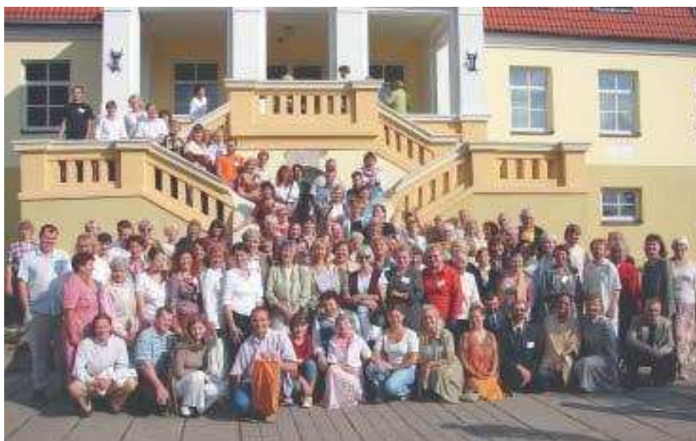
L'ESSE (Danemark) à un Séminaire de SSEHV en Lituanie

Après la Conférence, l'IESS-Australie a donné une formation supplémentaire aux animateurs dans plusieurs pays. Des ateliers, des Séminaires et des Conférences ont été tenus en Nouvelle Zélande (1999), en Papouasie Nouvelle Guinée (2001), à Fidji (2001), au Japon (2000, 2004), à Hong Kong (2000, 2004), à Taiwan (2000, 2004), en Malaisie (2004), en Indonésie (2004), au Sri Lanka (2000, 2005) et à Singapour (2004, 2006).